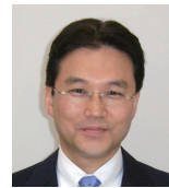
講師プロフィール