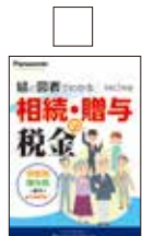
絵と図表でわかる 相続・贈与の税金 (小冊子)