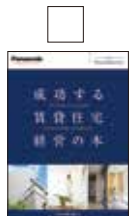
賃貸住宅ガイド 成功する賃貸 住宅経営の本